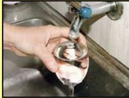
51% deus an dud n'evont ket dour tuellenn ken.

51% deus an dud goulennataet 'lâr eo, da gentañ, al labourerezh-douar. Met forzhig a dud 'soñj dezhe 'zo ul lodenn war chouk an uzinoù, pe c'hoazh dre an dour lousaet o teverañ deus pep ti (mekanikoù gwalc'hiñ, privezioù,...). Paotred ha merc'hed al liorzhoù 'vefe ivez gwalldroet da implij ar « pulve-dorn » war ar fleur, al legumaj, pe an aleoù. Un niver bras a Vretoned zo nec'het gant saotradur an dour , 66%, ar pezh a ra kalz !