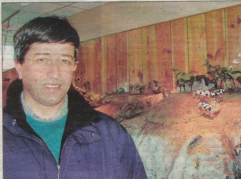
● Henri Goardon e Ti an Avel. Digoret eo bet an ti-se e miz gouere.

Eizh tour avel a vez o treiñ e Goulien. Feurmet e vez ar parkeier gant Cegelec ha Neg Micon, ur stal a vro Danmark, an hini kentañ war ar marc'had-se er bed a-bezh. Gwerzhet e vez an tredan da EDF. Peadra da bourchas ha tommañ 2000 pe 3000 tiegezh.